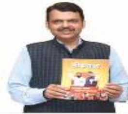
देवेंद्र फडणवीस उपमुख्यमंत्री