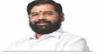
एकनाथ शिंदे मुख्यमंत्री

● महात्मा ज्योतीराव फुले जन आरोग्य योजना ●