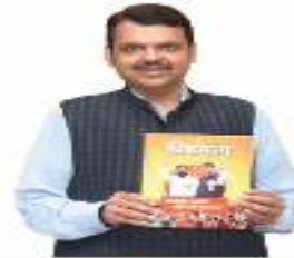
देवेंद्र फडणवीस उपमुख्यमंत्री