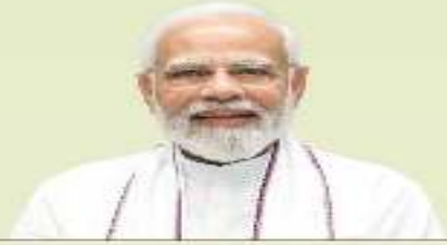
नरेंद्र मोदी प्रधानमंत्री