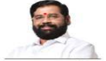
एकनाथ शिंदे मुख्यमंत्री