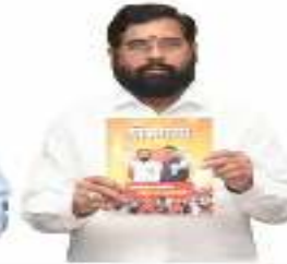
एकनाथ शिंदे मुख्यमंत्री