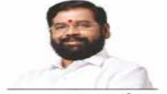
एकनाथ शिंदे मुख्यमंत्री