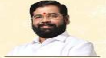
एकनाथ शिंदे मुख्यमंत्री