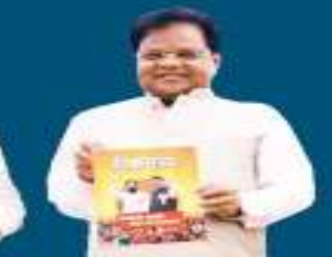
तानाजी सावंत मंत्री, सार्वजनिक आरोग्य व कुटुंब कल्याण