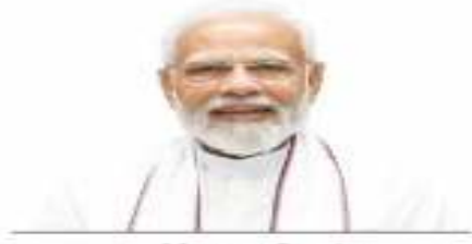
नरेंद्र मोदी प्रधानमंत्री