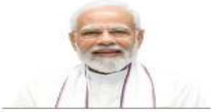
नरेंद्र मोदी प्रधानमंत्री