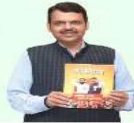
देवेंद्र फडणवीस उपमुख्यमंत्री