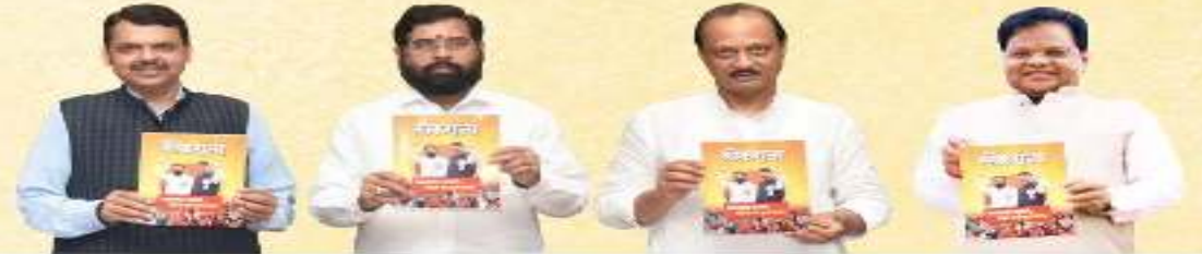
देवेन्द्र फडणवीस उपमुख्यमंत्री