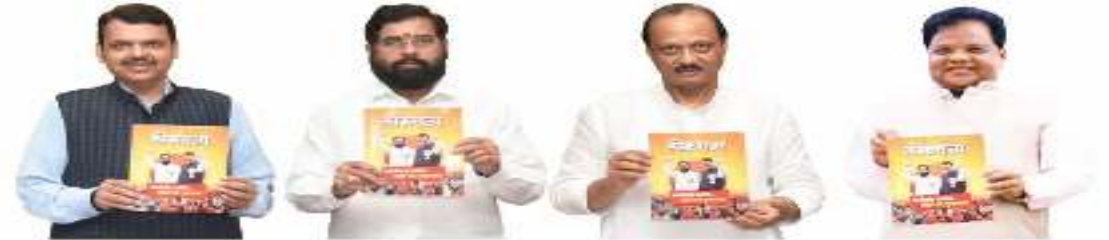
देवेन्द्र फडणवीस उपमुख्यमंत्री