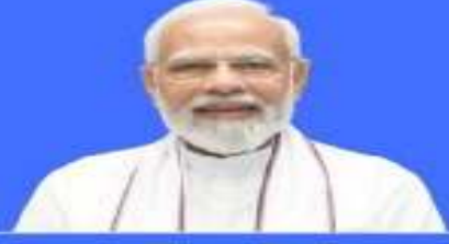
नरेंद्र मोदी प्रधानमंत्री