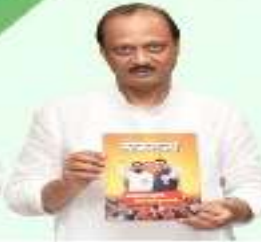
अजित पवार उपमुख्यमंत्री