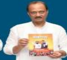
अजित पवार उपमुख्यमंत्री