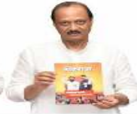
अजित पवार उपमुख्यमंत्री