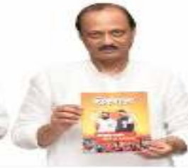
अजित पवार उपमुख्यमंत्री