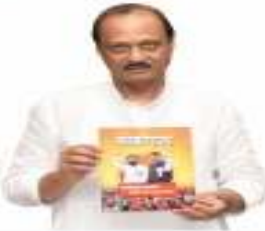
अजित पवार उपमुख्यमंत्री