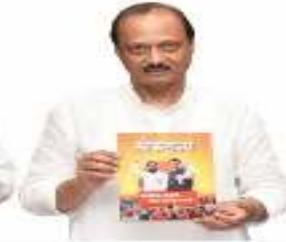
अजित पवार उपमुख्यमंत्री