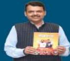
देवेंद्र फडणवीस उपमुख्यमंत्री