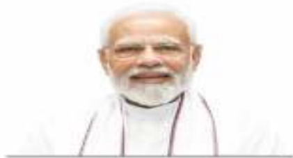
नरेंद्र मोदी प्रधानमंत्री