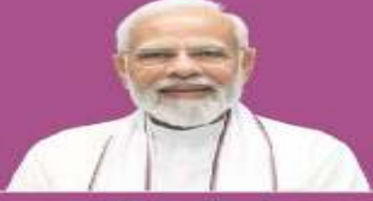
नरेंद्र मोदी प्रधानमंत्री