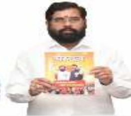
एकनाथ शिंदे मुख्यमंत्री