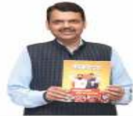
देवेंद्र फडणवीस उपमुख्यमंत्री