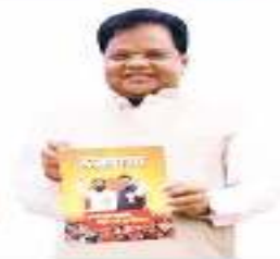
तानाजी सावंत मंत्री, सार्वजनिक आरोग्य व कुटुंब कल्याण