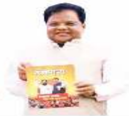
तानाजी सावंत मंत्री, सार्वजनिक आरोग्य व कुटुंब कल्याण