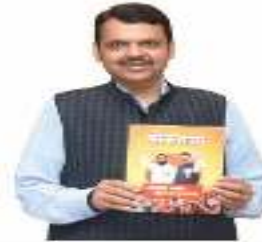
देवेंद्र फडणवीस उपमुख्यमंत्री