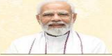
नरेंद्र मोदी प्रधानमंत्री