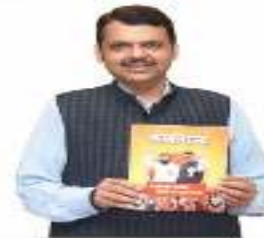
देवेंद्र फडणवीस उपमुख्यमंत्री

सेवा प्राप्तीसाठी १०४ या हेल्पलाईन क्रमांकावर संपर्क साधावा