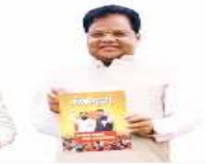
तानाजी सावंत मंत्री, सार्वजनिक आरोग्य व कुटुंब कल्याण