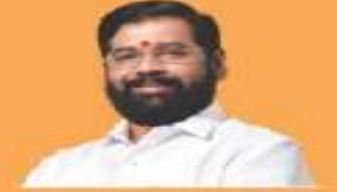
एकनाथ शिंदे मुख्यमंत्री