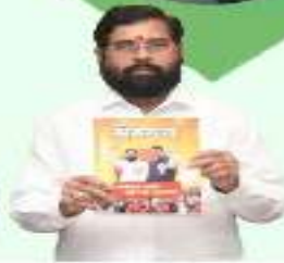
एकनाथ शिंदे मुख्यमंत्री