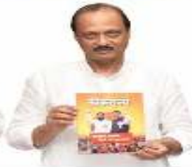
अजित पवार उपमुख्यमंत्री