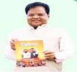
तानाजी सावंत मंत्री, सार्वजनिक आरोग्य व कुटुंब कल्याण