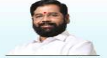
एकनाथ शिंदे मुख्यमंत्री