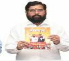
एकनाथ शिंदे मुख्यमंत्री