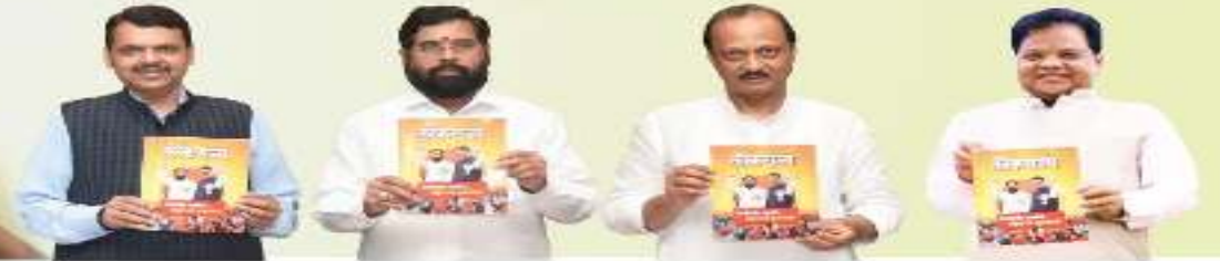
देवेंद्र फडणवीस उपमुख्यमंत्री

प्राथमिक आरोग्य केंद्र व ग्रामीण रुग्णालयात जिरीअंद्रीक सेवा देण्याकरिता शिबिरे