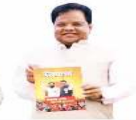
तानाजी सावंत मंत्री, सार्वजनिक आरोग्य व कुटुंब कल्याण